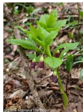
Lucie Kobřilová (flora.tpo.cz)