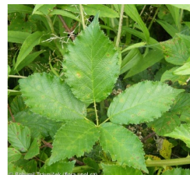
Bohumil Travníček (flora.upol.cz)