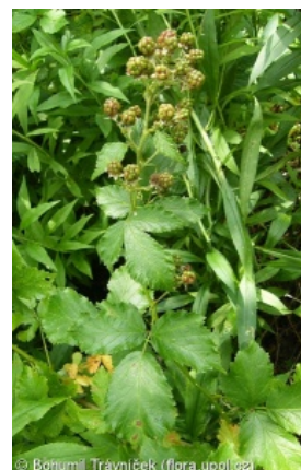
Bohumil Travníček (flora.upol.cz)