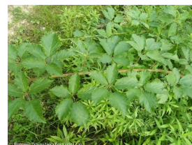
Bohumil Travníček (flora.upol.cz)